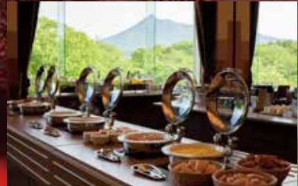
buffetレストラン プリンスホール (ホテル3F)