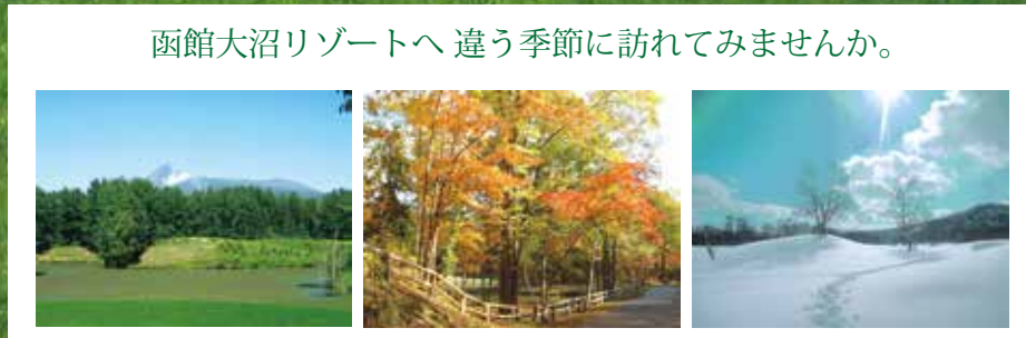
函館大沼リゾートへ 違う季節に訪れてみませんか。