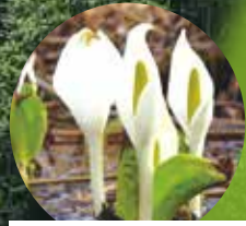
春の訪れを告げる水芭蕉