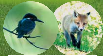
さまざまな野鳥や小動物が生息しており、素敵な出会いがあるかもしれません。