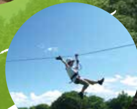
ホテルで出来るアクティビティのジップラインアドベンチャー。さあ、大沼の森で鳥になろう。