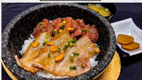
石焼スタミナ飯 (牛・豚バラ肉)