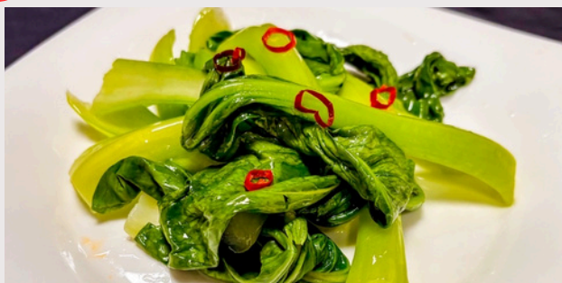
チンゲン菜のニンニク風味炒め