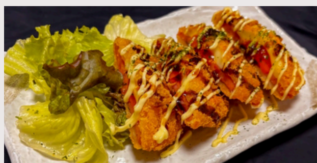
ハムエッグフライ