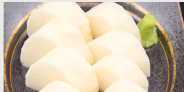
雫石産ながいも 白だしつゆ漬け