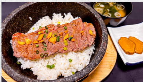
石焼スタミナ飯 (牛肉)