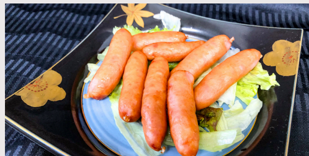
荒挽きウインナー