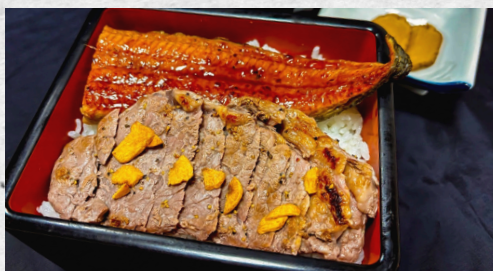
うなぎとステーキ重