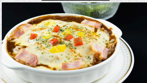
焼きチーズカレー