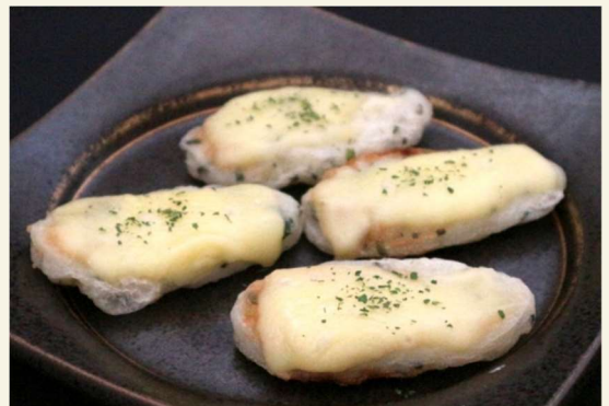
ミニしそ笹かまチーズ焼き