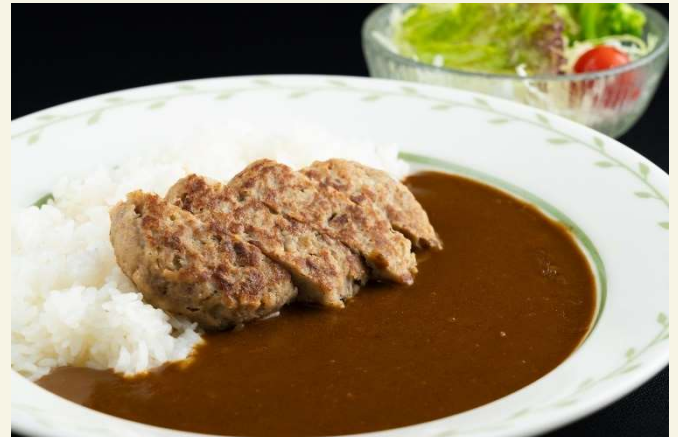
ハンバーグカレー (サラダ付き)