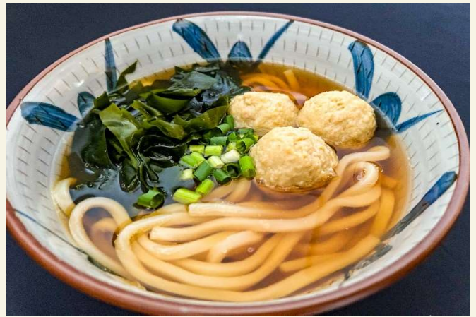
鶏つみれ入りうどん