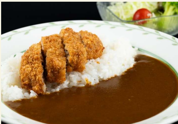
メンチカツカレー (サラダ付き)