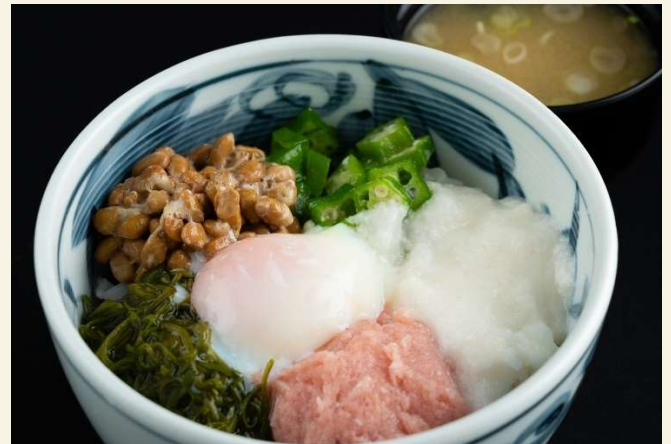
ネバネバ丼 (味噌汁付き)