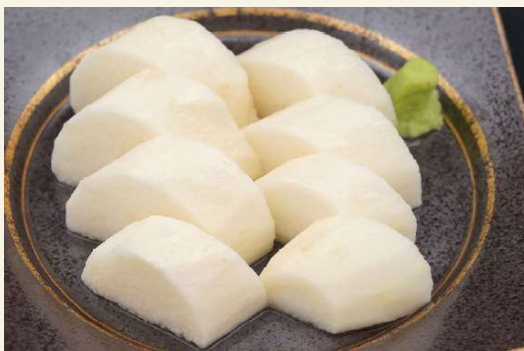
雫石産ながいも 白だしつゆ漬け