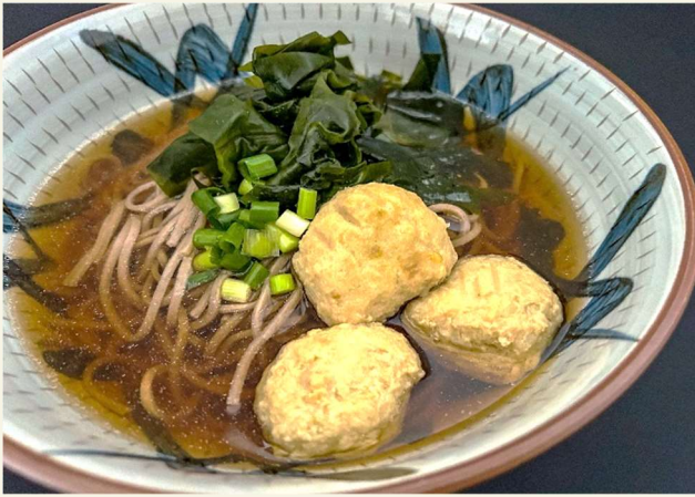
鶏つみれ入りそば