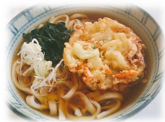
かき揚げうどん (温・冷)