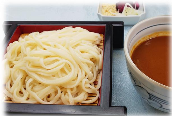
カレー つけ汁うどん