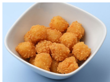
カリカリ チーズ揚げ