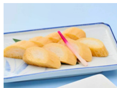
山芋梅香 醤油漬け