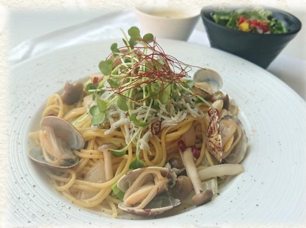
しらすとあさりの ペペロンチーノ