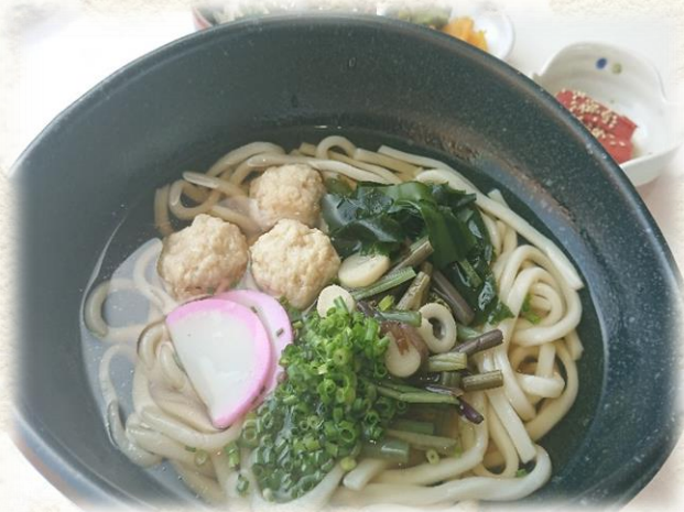
みつせ鶏つくねと 山菜のわかめうどん