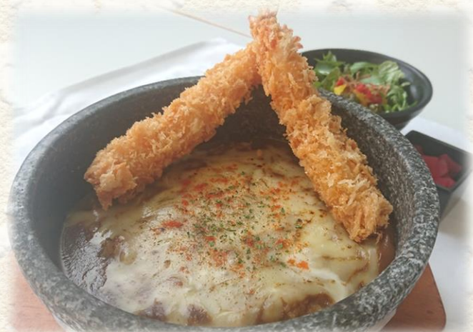
W海老フライ& 石焼チーズカレー