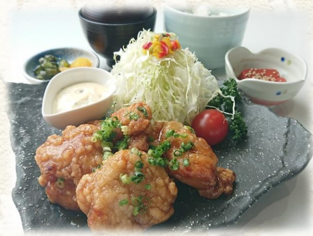
竜田チキン南蛮膳