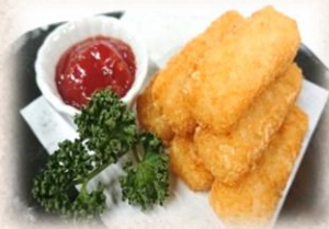
ハッシュドポテト