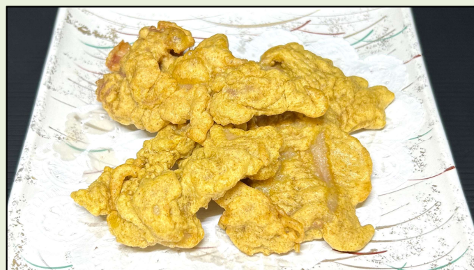
豚の中華風唐揚げ (カレー風味)