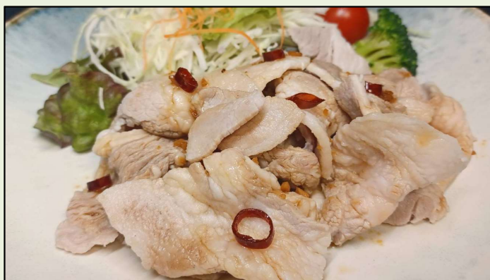
おつまみ雲白肉(ウンパイルー)