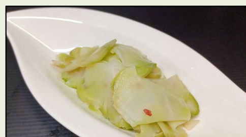
緑色搾菜(ザーサイ)