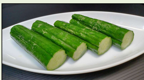
きゅうりの辛子漬け