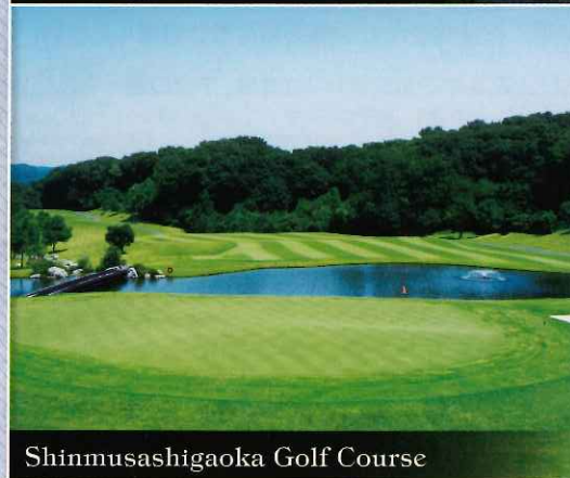
Shinmusashigaoka Golf Course