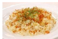
ガーリックライス ¥350