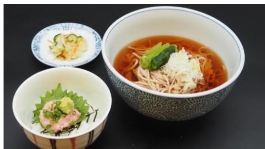
ミニまぐろたたき丼