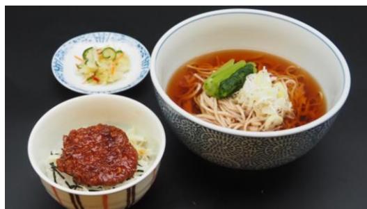
ミニソースカツ丼