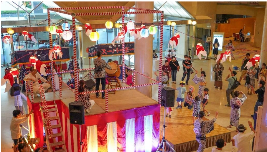
涼しい屋内で盆踊りや縁日を楽しめるおまつり広場

涼しく快適な空間でご家族の夏の思い出作りが叶う、どこか懐かしい笑顔あふれるひとときを演出いたします。