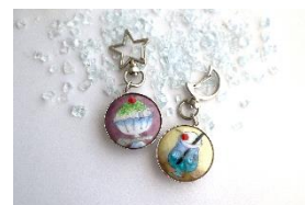
京七宝 de 夏のチャームホルダー作り体験