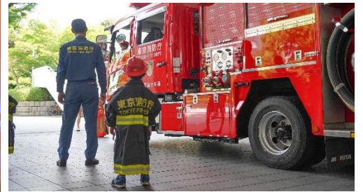
画像(上)相撲稽古イメージ/(下)消防体験