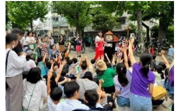
ヤムちゃんによる紙芝居ショー