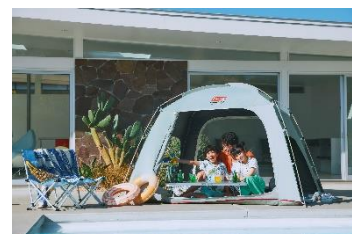
親子でキャンプ体験

※写真はイメージです。 ※表示料金には消費税が含まれております。 ※イベント内容は予告なく変更となる場合がございます。 ※仕入れの状況により、食材・メニューに変更がある場合がございます。 ※「縁日グルメ」につきまして、8品目(えび、かに、くるみ、小麦、そば、卵、乳、落花生)の対応はいたしかねます。 ※上記内容はリリース時点(7月9日)の情報です。