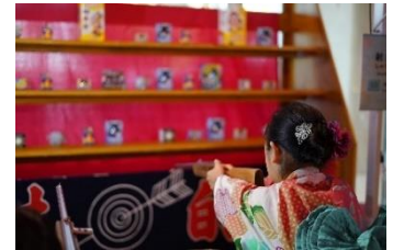
縁日屋台を楽しむ