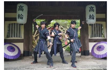
忍者パフォーマンスショー