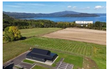
屈斜路プリンスホテルと葡萄畑が広がる屈斜路カルデラワイナリー

2024年開業の屈斜路カルデラワイナリーとの共同企画として、地域の魅力を体感いただける企画をご用意しました。ワイナリーでは、収穫期を迎える葡萄畑をガイドの案内で散策いただき、ワイン造りやブドウ畑について学びながら、 てしかが 弟子屈産ワイン用ブドウを使用した「テシカサイダー」をご提供いたします。ご夕食は、弟子屈チーズや摩周湖和牛など地元食材を生かしたフレンチディナーをご用意。ホテルソムリエによるペアリングとともに、屈斜路カルデラならではの味覚をご堪能いただけます。