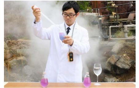
「温泉カメレオン実験」の様子

自家源泉の蒸気をグリーンエネルギーとして活用してきた箱根湯の花プリンスホテルの歩みを紐解く「ゆのはな湯学」と、紫キャベツの水溶液で温泉の性質を調べる「温泉カメレオン実験」の二部構成でお届けします。ただ入浴するだけでは終わらない、温泉を“科学する”特別な体験です。次世代を担う子どもたちの探究心を育み、いつもの温泉がより楽しくなる驚きと感動のひとつを提供いたします。