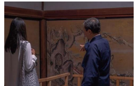
執事による解説を聞きながら寺内を巡る特別拝観

プラン詳細 URL: https://www.princehotels.co.jp/kyoto/plan/jissoin_rakuhokustay/