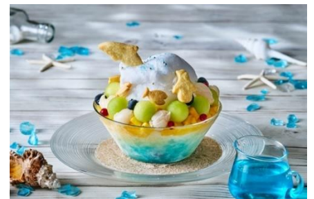
波乗りイルカのマリンかき氷