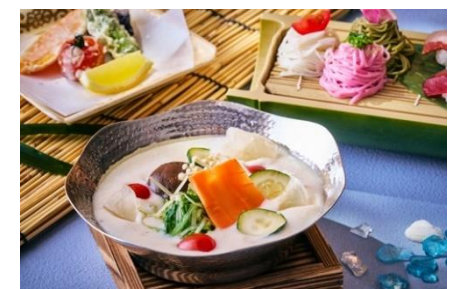
胡麻香る 豆乳ひんやり鍋御膳

プラン詳細 URL: https://www.princehotels.co.jp/shinagawa/summer/