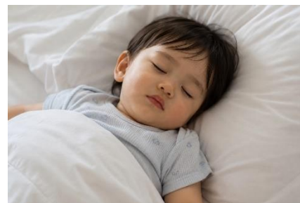
プールで遊び疲れたらホテルのお部屋でお昼寝タイム