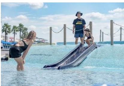
安心のライフガードによる見守り