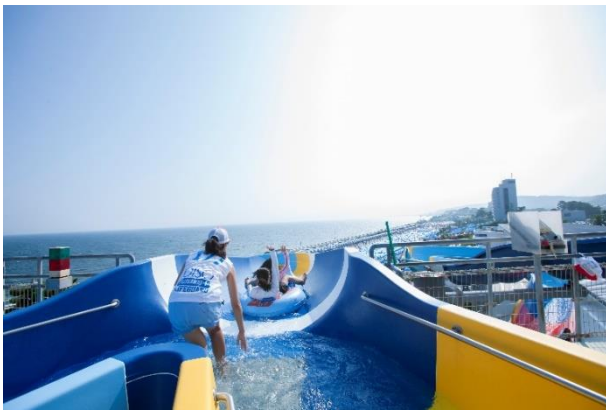
ウォータースライダー

さらに、隣接する大磯プリンスホテルでは、相模湾を望む温水インフィニティプールをはじめ、天然温泉やサウナを備えた「THERMAL SPA S.WAVE」を併設しており、大磯ロングビーチとともに楽しめる滞在型リゾートとしてご利用いただけます。