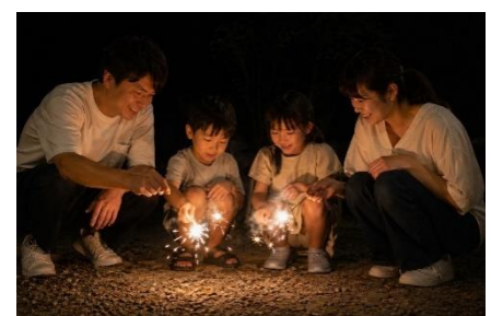
ホテル前で手持ち花火を体験