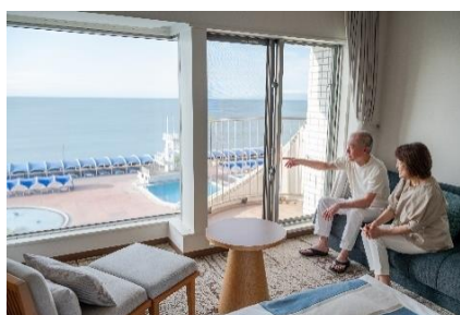
大磯ロングビーチ併設ホテルで安心のステイ