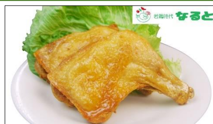
ディナー限定 『若鶏時代なると』の「若鶏レッグ揚げ」