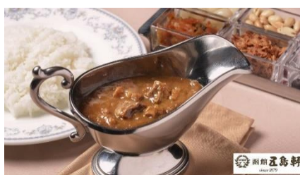
【8/8～8/16】サマーウィークディナー限定 『五島軒』の「イギリス風カレー」