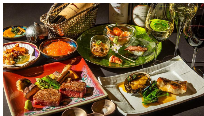
北海道産黒毛和牛×3種ペアリングワイン(6・7月)

※料金には、消費税が含まれております。別途サービス料13%を加算させていただきます。