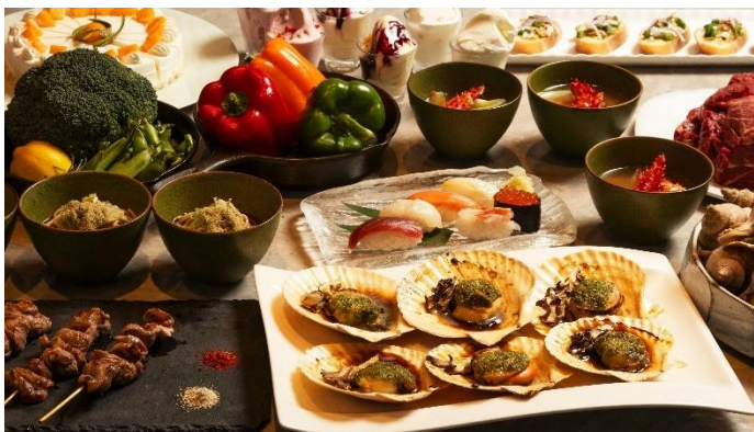
「北海道フェア 2026」ディナーブッフェイメージ

また、「中国料理 芙蓉城」「ステーキハウス 桂」「スカイラウンジ トップ オブ プリンス」でも北海道産食材にこだわったメニュー、コースをご用意しております。札幌プリンスホテルは、“北海道らしさ”を追求したフェアを通じて北海道の食の価値をあらためて見つめ直す機会を創出します。