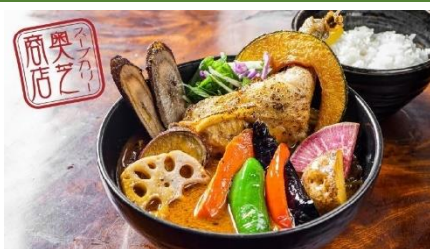
ランチ限定 『奥芝商店』の「スープカレー」