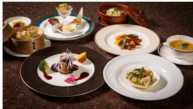
芙蓉菜譜～ふようさいふ～(6・7月)

※料金には、消費税が含まれております。別途サービス料13%を加算させていただきます。