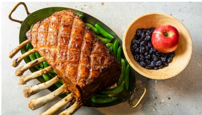
かみふらの産骨付きポークのプレゼ ハスカップとりんごのソース