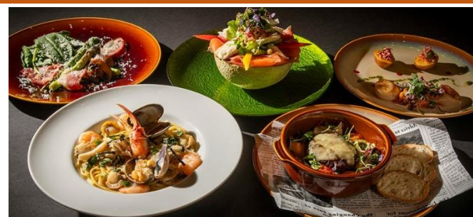
フードメニュー各種

※ディナータイムご利用のお客さまのみテーブルチャージ1名さま¥800を別途頂戴いたします。