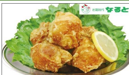
ランチ・ディナー 『若鶏時代なると』の「ざんざん」