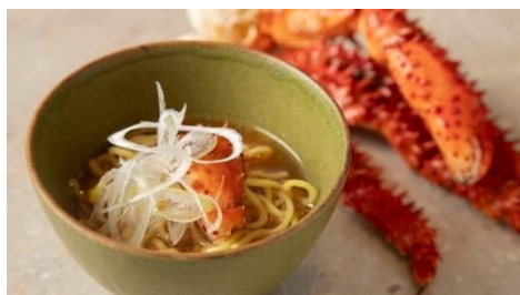
花咲がにラーメン