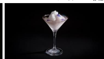
氷獄の鎮魂歌～ラベンダー・ヘイズ～

※本資料の記載内容は、2026年6月29日現在のものであり、変更となる場合がございます。