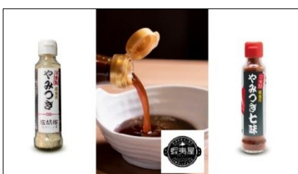
ディナー限定 『北海道ジンギスカン 蝦夷屋』の 「蝦夷屋ジンギスカンのたれ」 「やみつぎ塩胡椒」「やみつぎ七味」