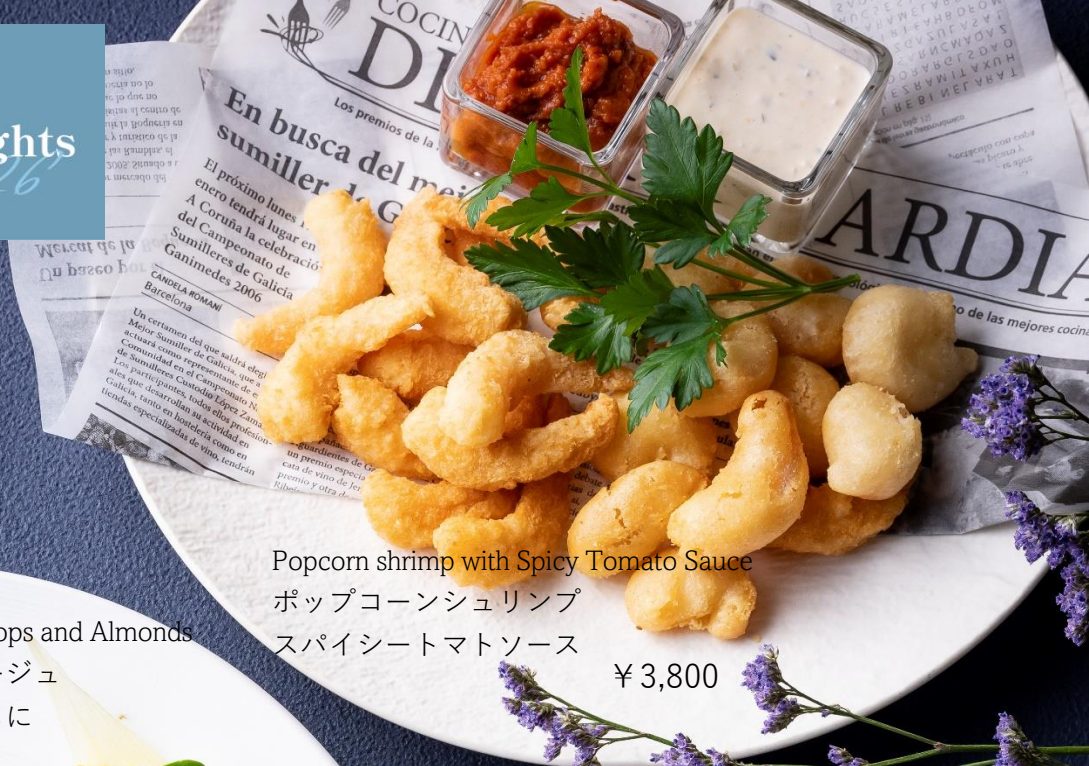
Popcorn shrimp with Spicy Tomato Sauce