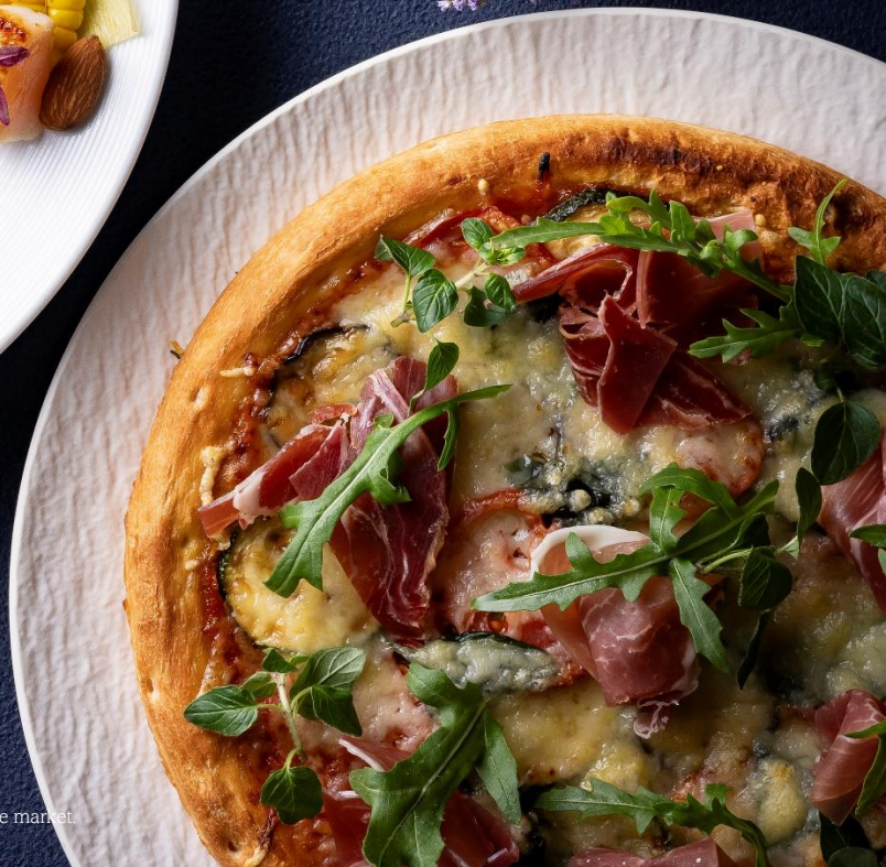
Prosciutto Pizza with Summer Vegetables and Herbs