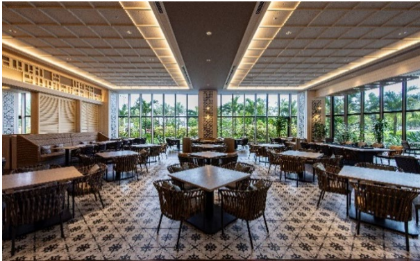
オールデイダイニング ジノーン

沖縄・ぎのわんの魅力をさらに引き出しているのは、オールデイダイニング ジノーンのご朝食。220 席を誇る解放感溢れるレストランで、buffeスタイルでお気に召すままお楽しみいただけるご朝食付き。例えば、連泊でゆったりとお過ごしいただく皆さまにはクラブラウンジ UMIKAJI とオールデイダイニング ジノーンの二つのご朝食を味わっていただけるのも魅力です。