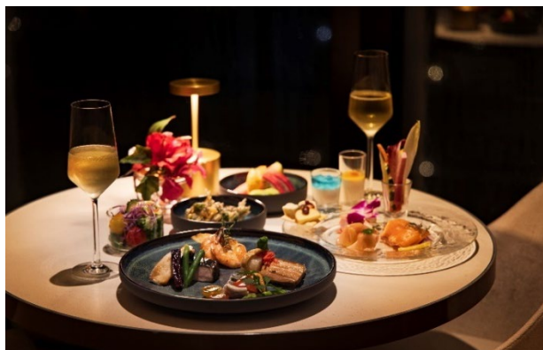
サンセットラウンジイメージ

ぎのわんに広がる碧く豊かな美ら海をお愉しみいただくお客さまのシーン・ニーズを探求し、朝な夕なにそれぞれの魅力あるお食事を提供いたします。