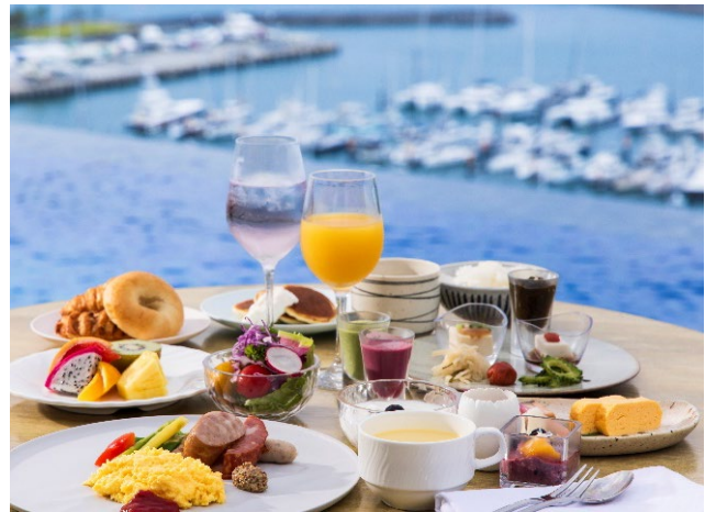
モーニングラウンジ