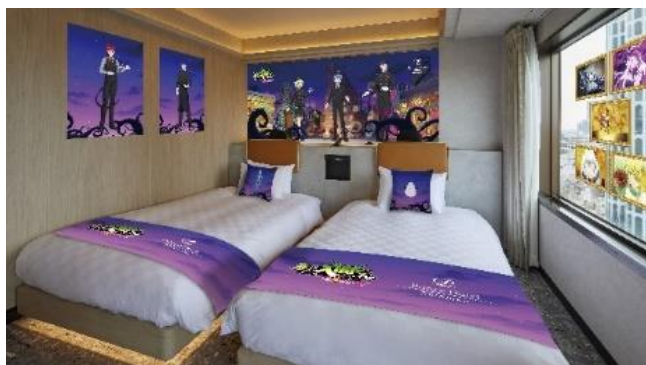
「アニメ「魔入りました！入間くん」“ようこそ、魔界ホテルへ”イマーシブルームステイ」イメージ