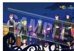
(2)「プラン限定ポストカード」イメージ