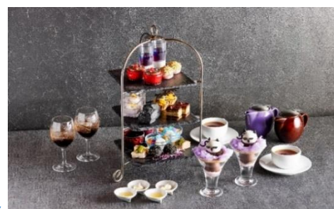
「コラボレーションアフタヌーンティー」イメージ