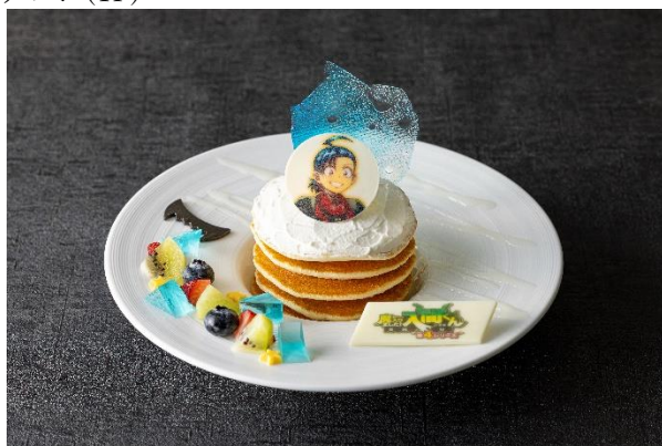
「入間くんの欲張りマシマシ・パンケーキ」イメージ