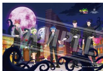
「プラン限定描き下ろしイラストポストカード」イメージ