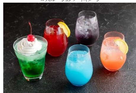
コラボレーションドリンクイメージ