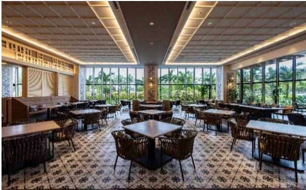
オールデイダイニング ジノーン

沖縄・ぎのわんの魅力をさらに引き出しているのは、オールデイダイニング ジノーンのご朝食。220 席を誇る解放感溢れるレストランで、ブッフェスタイルでお気に召すままお楽しみいただけるご朝食付き。例えば、連泊でゆったりとお過ごしいただく皆さまにはクラブラウンジ UMIKAJI とオールデイダイニング ジノーンの二つのご朝食を味わっていただけるのも魅力です。