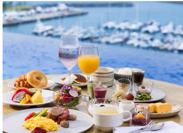
モーニングラウンジ