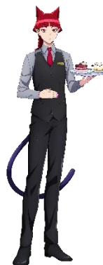
今回のコラボレーションに合わせた描き下ろしキャラクター