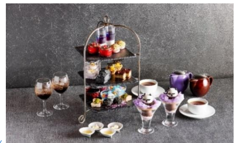
「コラボレーションアフタヌーンティー」イメージ