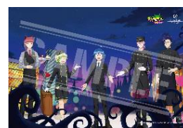
(2)「プラン限定ポストカード」イメージ