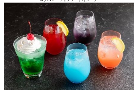
コラボレーションドリンクイメージ