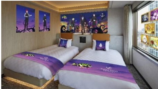
「アニメ「魔入りました！入間くん」“ようこそ、魔界ホテルへ”イマーシブルームステイ」イメージ