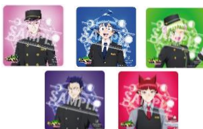
(1)「プラン限定コースター」イメージ