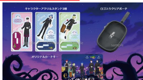
「プラン限定オリジナルグッズ」イメージ

第4シリーズのテーマである「音楽祭」をコンセプトにしたお部屋をご用意。ステージを思わせる装飾や音符、印象的な楽譜が空間を彩り、問題児(アブノーマル)クラスとともにその世界観を体感いただけます。