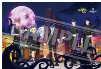
「プラン限定描き下ろしイラストポストカード」イメージ