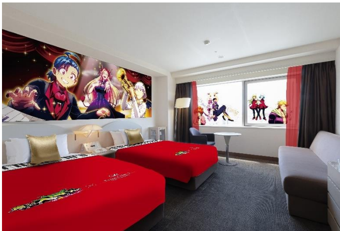
「魔入りました！入間くん音楽祭コンセプトスタイルーム」イメージ

◀宿泊者限定グッズ付き / 「魔入りました！入間くん音楽祭コンセプトスタイルーム」▶