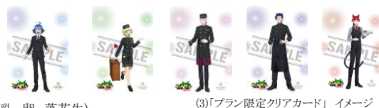
(3)「プラン限定クリアカード」イメージ