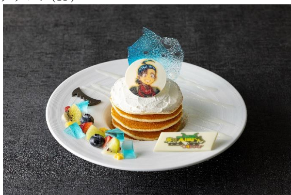
「入間くんの欲張りマシマシ・パンケーキ」イメージ