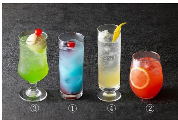
「コラボレーションドリンク」イメージ

【時 間】 11:00A.M.～6:00P.M. ※120分制。※(2)(3)はご利用前日 12:00NOONまでの予約制。