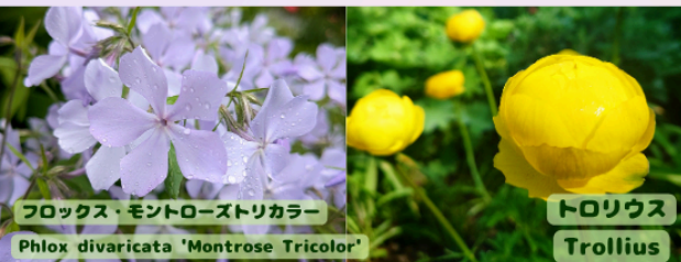
フロックス・モントローズトリカラー Phlox divaricata 'Montrose Tricolor'