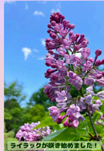
ライラックが咲き始めました!