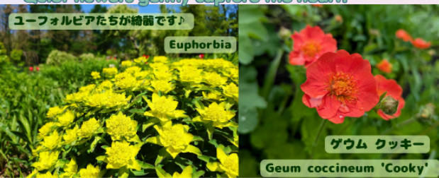
ユーフォルビアたちが綺麗です♪

Early summer is when the garden feels most alive. Quiet flowers gently capture the heart.