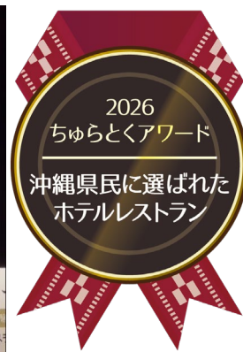
(第10回ちゅらとくアワード表彰式)

「オールデイダイニング ジノーン」では、季節ごとにテーマを設けたブッフェメニューを提供しており、200席以上を備える開放感あふれる空間の中で、ゆったりとした時間をお過ごしいただけます。