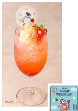
ピンガのりんご飴 シャーベットサイダー