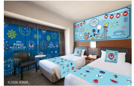
コンセプトルームイメージ

※上記料金は 1 室 2 名さまご利用時の料金です。 ※料金には 1 泊室料、オリジナルグッズ、サービス料、消費税が含まれております。 ※料金はご宿泊日、ご利用人数により異なります。詳細は専用 Web サイトをご確認ください。