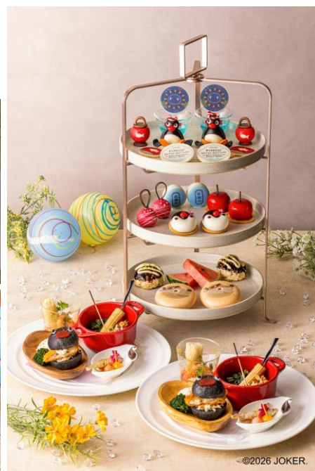
コラボレーションアフタヌーンティー