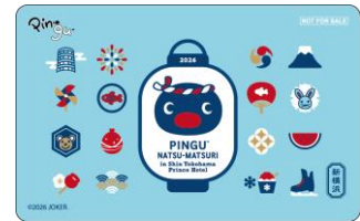
オリジナルカードキー