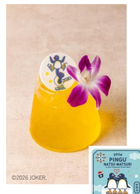
ピングー&ピンギの かき氷レモネード