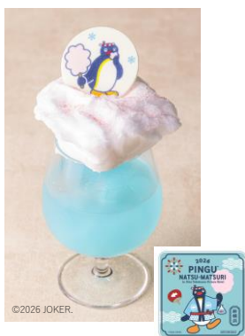
ピングーの コットンキャンディードリンク