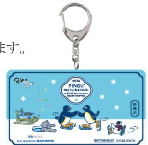
アクリルキーホルダー

※料金には、一般滑走、貸靴、オリジナルグッズ、消費税が含まれております。 ※ご予約は受けておりません。 ※一般滑走可能日のみの実施となります。スケジュールは Web サイトよりご確認ください。