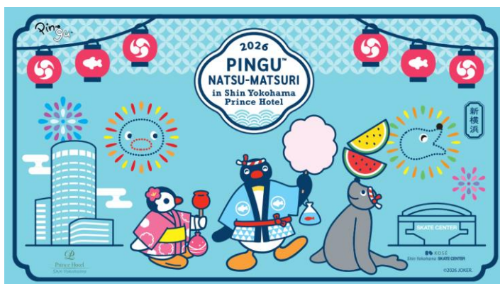
ホテル オリジナルイラスト

可愛いピングーたちと一緒に、お祭り気分で盛り上がる夏のひとときをお楽しみください。