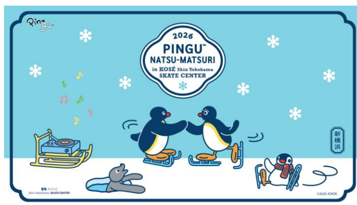
スケートセンター オリジナルイラスト