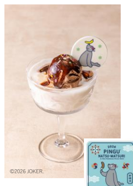
ロビの チョコバナナミルク