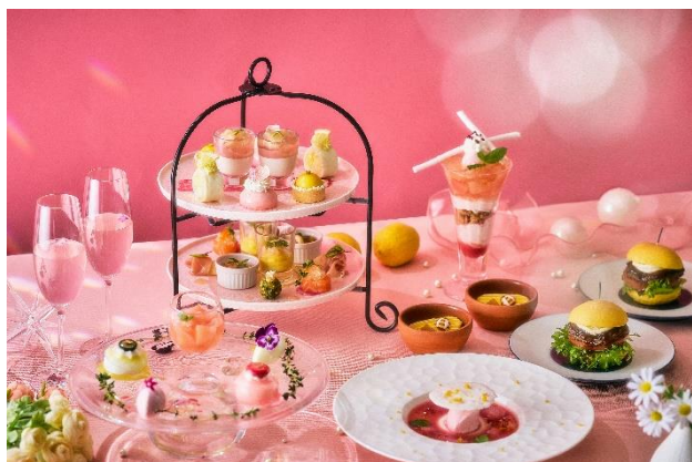
桃とレモンがきらめくサマーアフタヌーンティー メニュー

【お問 合 せ】レストラン総合予約 TEL:03-5421-1114(受付時間:10:00A.M.～6:00P.M.)