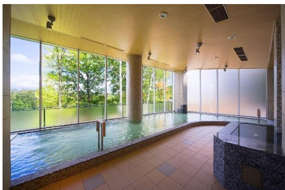
富良野温泉 紫彩の湯 内風呂

こうした課題を踏まえ、シルバー層からお子さままですべてのお客さまが快適にご利用いただけるよう、温泉施設と宿泊棟を最短距離で結ぶ新たな通路を設けます。階段の昇降を最小限に抑えるとともに移動距離の大幅な短縮により、さらなるバリアフリー化を実現いたします。また、新たに通路を片面ガラス張りの造作にすることにより、富良野の美しい景観を堪能しながら温泉までの道のりもお楽しみいただけます。