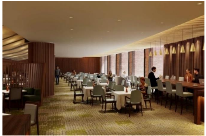
外光が差し込むテラスを臨むエリアイメージ