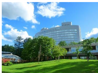
新富良野プリンスホテル

「プリンスグランドリゾート富良野」は、西武グループが北海道・富良野エリアで展開する滞在型リゾートです。ホテルやスキー場、ゴルフ場をはじめ、「ニングルテラス」、「Soh's BAR」、「ル・ゴロワ フラノ」などの観光施設や多彩な飲食施設を備え、四季を通じて多様な滞在体験を提供しています。豊かな自然環境を活かしながら、訪れるすべてのお客さまに快適で魅力ある時間を提供するとともに、地域と連携したリゾート運営を推進しています。2028 年度 には新富良野プリンスホテルより徒歩約 7 分の場所に富良野の豊かな自然に調和したウイスキー蒸留所であり、世界からの注目度の高い軽井沢蒸留酒製造が運営する富良詩蒸留所が開業予定です。