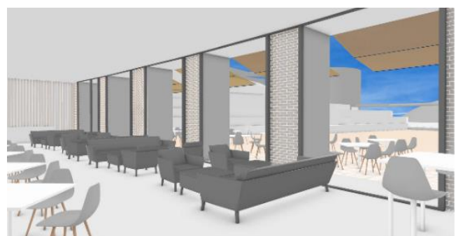
テラスを臨むメインバンケットホールのソファ席