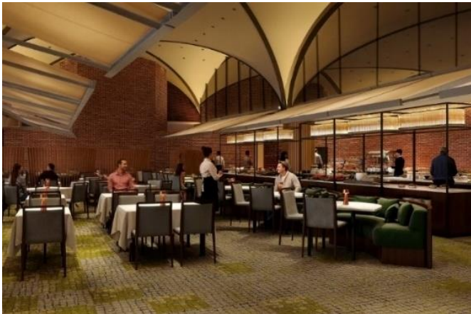
メインバンケットホール 内観イメージ

従来と比較してより開放的かつ機能的な空間へと生まれ変わった「メインバンケットホール」はご利用いただく皆さまの満足度の向上を企図するとともに、宴会場の機能を強化することで、近年訪日外国人からも注目の集まる国際都市富良野として MICE などの大型国際会議の受け入れや婚礼・宴会などさまざまな需要の取り込みを見据えて誘客を推進してまいります。