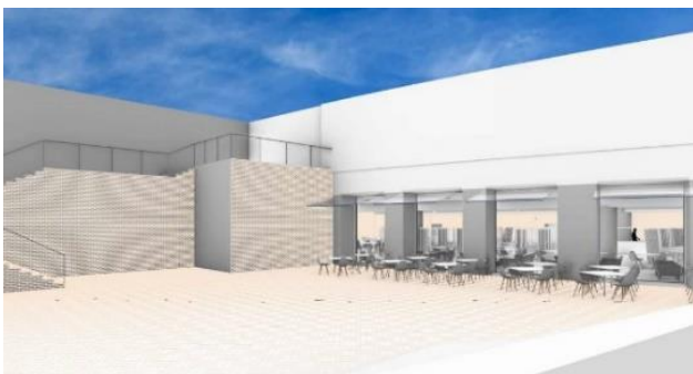
広々としたイベントスペースを要するテラス

メインバンケットホールに隣接し、富良野の雄大な自然が感じられる 30×14m の開放的なテラスを新設いたします。テラスとフロントロビーは大階段で繋がり、自由な往来を可能にすることで、ご宿泊のお客さまにとどまらず、地域のお客さまにも気軽にご利用いただける新たな集いの空間を提供いたします。今後は、当施設を活用した星空観賞会や BBQ・ビアガーデンなど、四季折々のイベントを展開することで、地域に根ざした新たな需要の創出と滞在価値の向上を目指してまいります。さらに、本テラスには焚火などを楽しめるファイヤーピットやテーブル席を設置し、スキーやスノーボード滑走後のひとときを楽しむ「アプレスキー」や、夜間の消費体験を充実させる「ナイトエコノミー」といった、富良野ならではの魅力を体感できる空間を演出します。富良野の上質な雪を求めて訪れる訪日外国人のお客さまの多様なニーズにも応え、夜の富良野に新たな賑わいをもたらします。