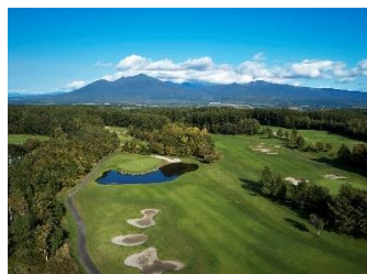
富良野ゴルフコース