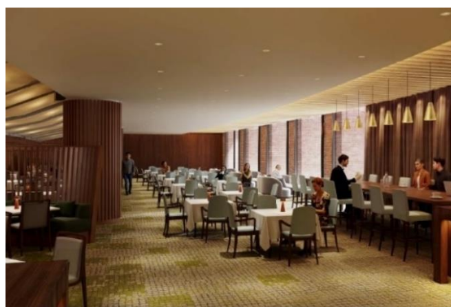
外光が差し込むテラスを臨むエリアイメージ