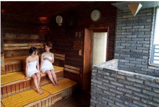
フィンランド式 オールドパインサウナ