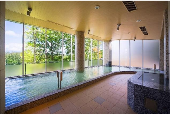
富良野温泉 紫彩の湯 内風呂

こうした課題を踏まえ、シルバー層からお子さままですべてのお客さまが快適にご利用いただけるよう、温泉施設と宿泊棟を最短距離で結ぶ新たな通路を設けます。階段の昇降を最小限に抑えるとともに移動距離の大幅な短縮により、さらなるバリアフリー化を実現いたします。また、新たに通路を片面ガラス張りの造作にすることにより、富良野の美しい景観を堪能しながら温泉までの道のりもお楽しみいただけます。