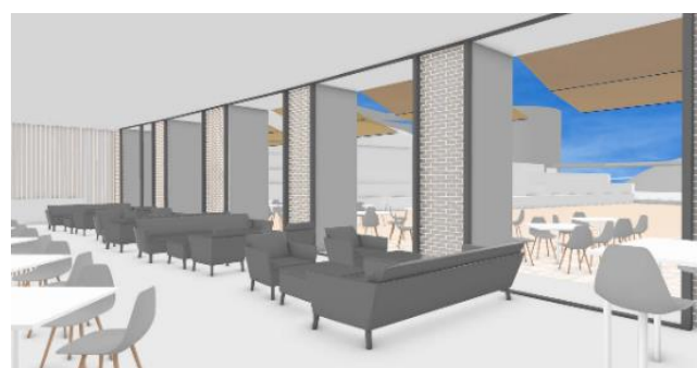
テラスを臨むメインバンケットホールのソファ席