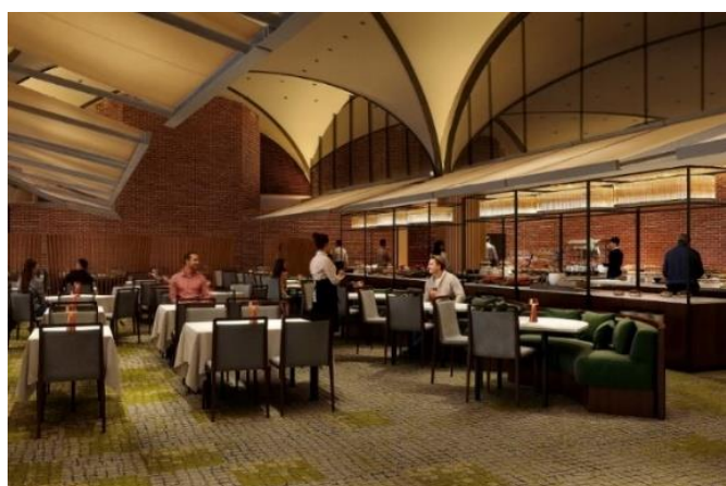
メインバンケットホール 内観イメージ

従来と比較してより開放的かつ機能的な空間へと生まれ変わった「メインバンケットホール」はご利用いただく皆さまの満足度の向上を企図するとともに、宴会場の機能を強化することで、近年訪日外国人からも注目の集まる国際都市富良野としてMICEなどの大型国際会議の受け入れや婚礼・宴会などさまざまな需要の取り込みを見据えて誘客を推進してまいります。