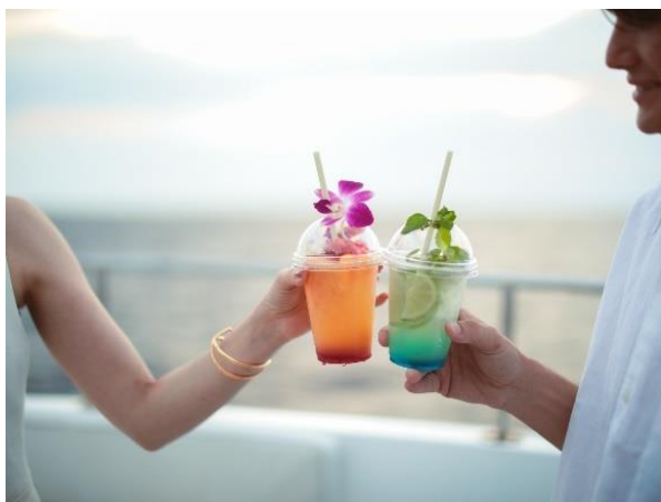
ホテルオリジナルカクテル(ノンアルコール)