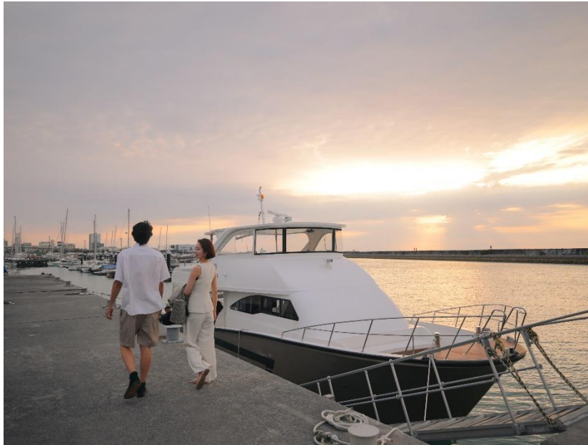
クルーズ船(イメージ)

沖縄プリンスホテル オーシャンビューぎのわん(沖縄県宜野湾市真志喜 3-28-1、総支配人:佐藤 傑)は、2026年7月1日(水)から9月30日(水)までの期間限定で、「サンセットクルーズ in 宜野湾」を開催いたします。沖縄西海岸に沈む夕陽と、人気観光地・北谷アメリカンビレッジの夜景を海上から楽しむ、非日常のクルージング体験をご提供いたします。