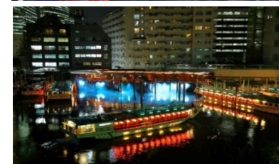
花火鑑賞クルーズ イメージ