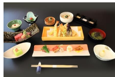
屋形船「船清」の「緑舟」コース イメージ

URL : https://www.princehotels.co.jp/shiomi/plan/yakatabune_hanabi_2026/