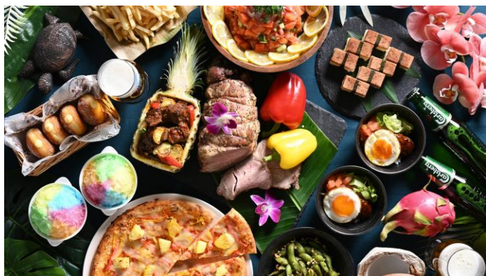
LeaLea！海辺のビアホール(イメージ)

今年のテーマは「Hana Hou！Hawaii(アンコール！ハワイ)」。昨年ご好評いただいた、リゾート感あふれるハワイのローカルフードを食べ放題でお楽しみいただけます。シェフが目の前で仕上げるロコモコ丼や、ふんわり食感のマラサダなど、新メニューもご用意しております。飲み放題のドリンクはサントリー株式会社の商品を中心に、ビールをはじめ、スタッフがカウンターで仕上げるカクテルなどをラインアップ。ノンアルコールのワインやカクテルも豊富に取りそろえます。7月18日(土)・19日(日)やお盆期間、シルバーウィークには、お食事を楽しみながら観覧いただける「ハワイアンステージ」も開催いたします。会場の大きな窓からは、潮風にそよぐヤシの木や、夕日に照らされた瀬戸内海もご覧いただけます。ご家族やご友人とともに、ハワイへ旅するような「Lea Lea(幸せ)」なひとときをお過ごしください。