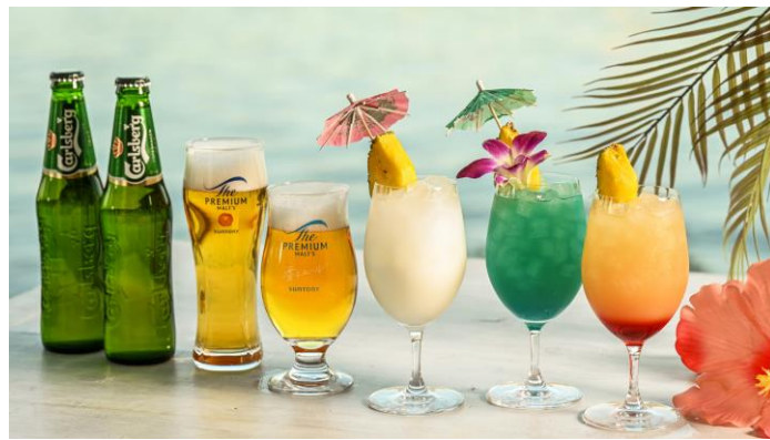
ドリンク(イメージ)