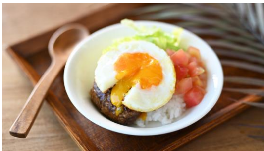
ロコモコ丼(イメージ)