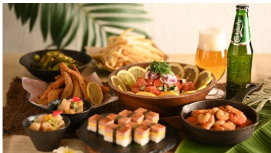
ハワイアンおつまみ(イメージ)

プリンスワイキキのレストラン「100 sails Restaurant&Bar」のクラムチャウダーをマイルドにアレンジ。