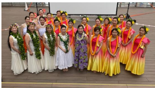
アロハレイフラスタジオ(イメージ)

お食事とともに楽しみいただける、フラダンスやウクレレのステージを開催。ハワイの雰囲気を存分にご体感いただけます。