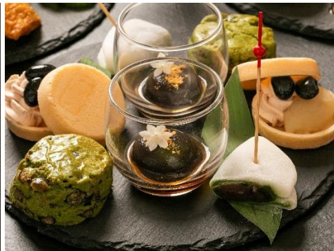
和スイーツプレート