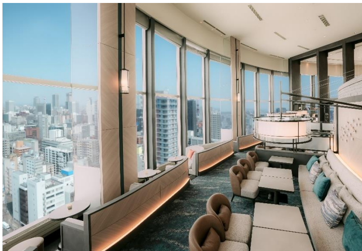
スカイラウンジ トップ オブ プリンス