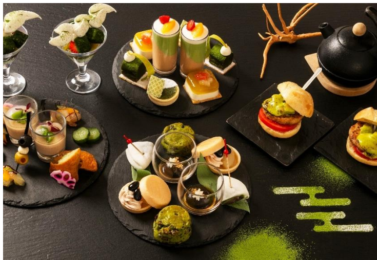
天空のアフタヌーンティー「翠茶(すいちや)」

また、宇治抹茶や玄米茶を用いた和菓子風スイーツや、抹茶味噌を使用したチーズアボカドバーガーなどのセイボリーも充実させました。さらに、別添えのミニパルフェには「新茶香るメレンゲと宇治抹茶ラスク 北海道ミルクアイスのパルフェ」をご用意し、新茶の季節ならではの爽やかな香りをお届けいたします。ドリンクは、紅茶やハーブティーに加え、水出し煎茶や和紅茶など、日本茶の多彩な味わいをフリーフローで提供。広がる街並みを一望する開放的な空間で、札幌にしながら京都の空気を感じられる「五感を旅する」ティータイムをお過ごしいただけます。