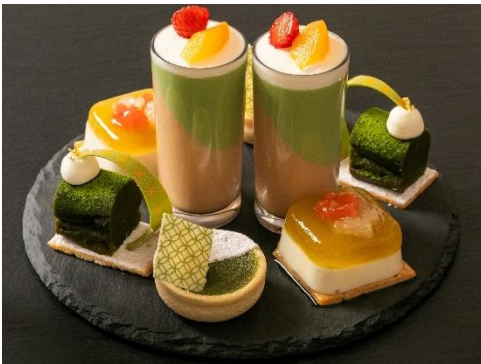
洋スイーツプレート