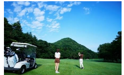
軽井沢 浅間ゴルフコース