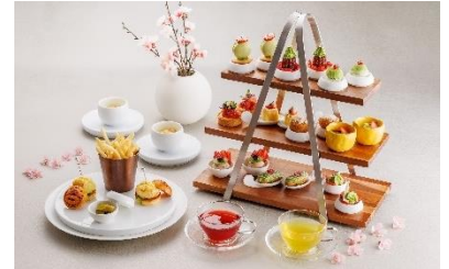
ASAMA Afternoon Tea

※当レストランにおける食物アレルギー対応につきましては、食品表示法により製造会社等(当社の食材仕入先)に表示義務のある特定原材料8品目(えび・かに・くるみ・小麦・そば・卵・乳・落花生)のみとさせていただきます。特定原材料8品目の対応をご希望のお客さまは事前にお申し出ください。