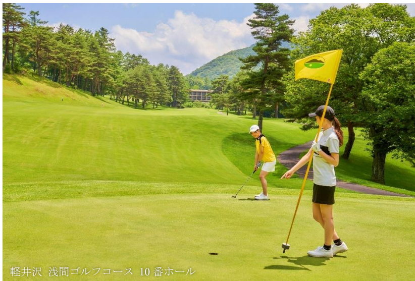
軽井沢 浅間ゴルフコース 10番ホール