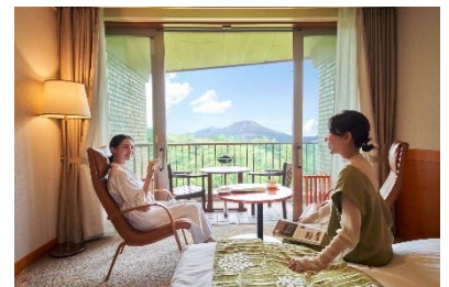
軽井沢 浅間プリンスホテル客室