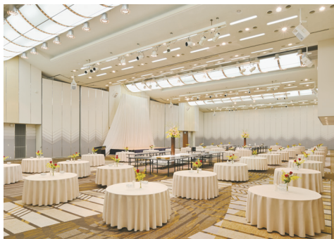
コンベンションホール「淡海」