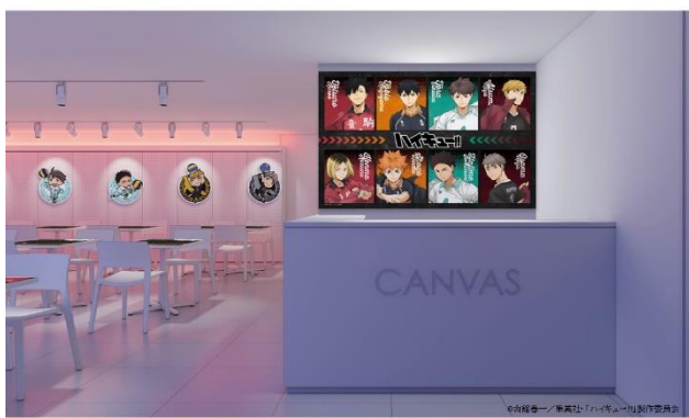
IKEPRI CANVAS 店内