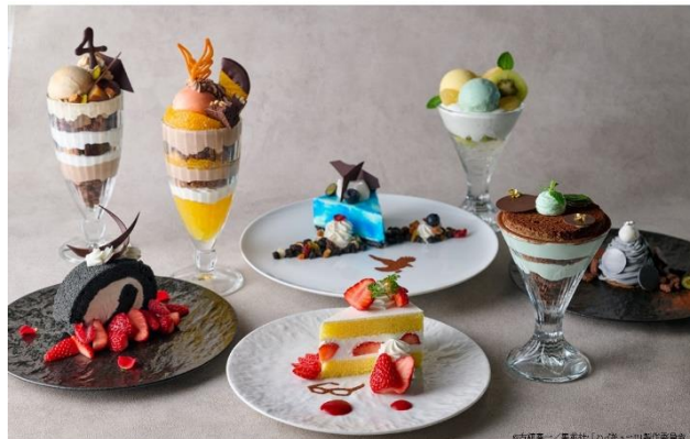
コラボレーションスイーツ