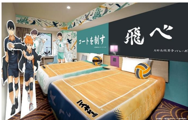
コンセプトルーム (一例)