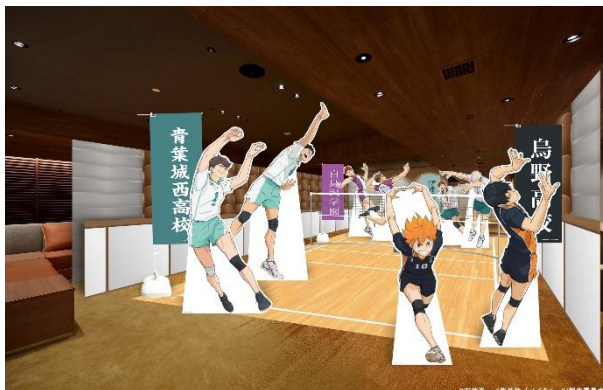
コンセプトラウンジ (一例)