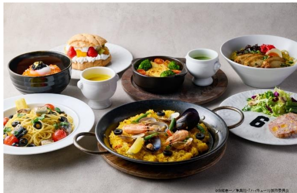
コラボレーションメニュー