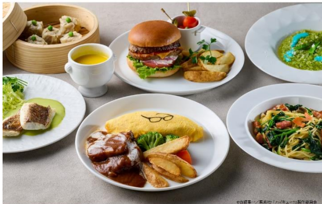
コラボレーションメニュー

前半は“キャラクターイメージ”、後半は“キャラクターの好きなもの”をテーマにしたコラボレーションフード&スイーツ、前半は“キャラクターカラー”、後半は“キャラクターのセリフ”をテーマにしたコラボレーションドリンクなど、前後半あわせて延べ72種展開いたします。アフタヌーンティーも前後半で内容を切り替え、期間を通じて異なるコンセプトのメニューをお楽しみいただけます。また、来場特典、注文特典、オリジナルグッズ購入特典など、ご利用者さま限定の特典を多数ご用意いたします。さらに、描き下ろしビジュアルを使用したオリジナルグッズをご用意し、ファン必携のコレクション性の高いアイテムを販売いたします。