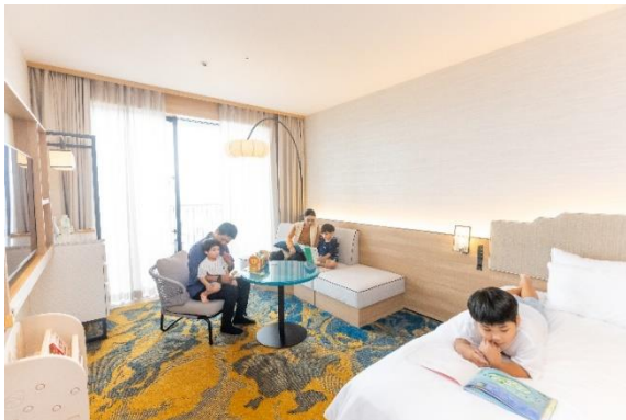
「ウェルカムベビーのお宿」認定ルーム 2室限定

認定部屋はオーシャンビューのデラックスツインルーム。ベッドが3台まで入る37.7㎡の広々とした客室で、ご自宅のように靴を脱いでカーペットの上でおくつろぎいただけます。水回りは浴槽、シャワーヘッドを完備したバスルームと独立洗面台、トイレに分かれているので、ゆっくりと湯船につかってお風呂タイムをお楽しみいただけます。その他コーナークッションやコンセントカバーの設置などお子さまのけがの防止に配慮し、安心してお過ごしいただくための工夫をしております。