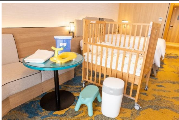
主要ベビーグッズ(要事前予約)

無料レンタル備品: ベビーベッド/ベッドガード/おねしょマット/お子さま用便座/おむつゴミ箱/ステップ台/ベビーバス/館内用ベビーカー/哺乳瓶洗浄機 ※数に限りがありますので事前にお申し出ください。