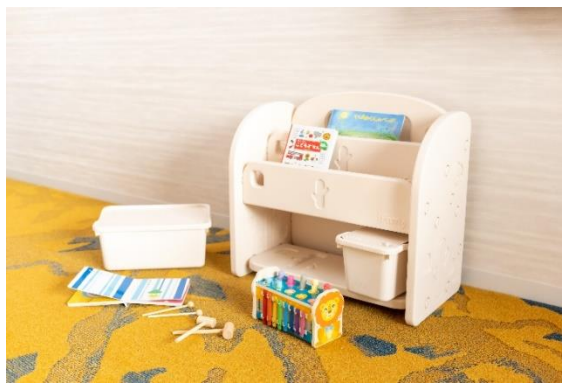
「ウェルカムベビー」デラックスツインルーム専用備品