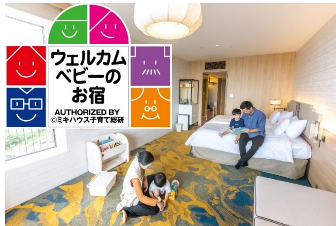
「ウェルカムベビーのお宿」認定客室

家族旅行における最大のニーズとして挙げられるのが、“子どもの年齢に応じた設備・サービスの充実”と“宿泊費の負担軽減”です。当ホテルではその声に応えるため、特にご要望の多い「小学生以下の添い寝のお子さまの宿泊代金無料」となるプランニーズに着目しました。このほど、赤ちゃん・お子さま連れのご家族が“はじめての沖縄旅行でも心から楽しめる”宿泊プランを設定し、よりファミリーでフレンドリーなご滞在の追求を図って参ります。