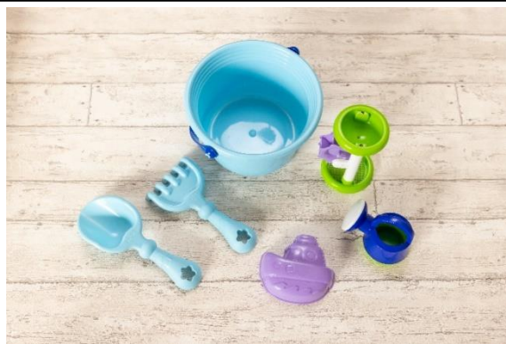
(無料貸出し) 砂場遊びセット ウェルカムベビープラン限定