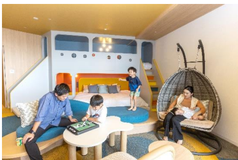
ファミリールーム

■WEB: https://www.princehotels.co.jp/ginowan/plan/familyroomstayplan2026