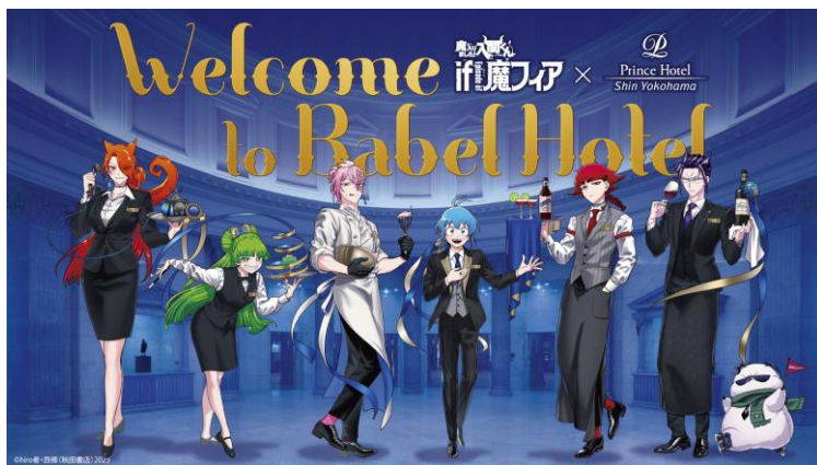
描き下ろしイラスト

当コラボレーションでしか体験できない、作品の世界観に浸るひとときをお過ごしください。