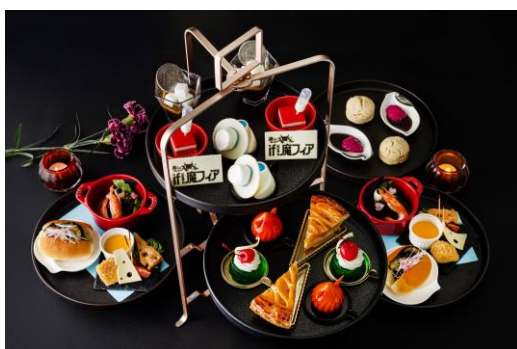
コラボレーションアフタヌーンティー