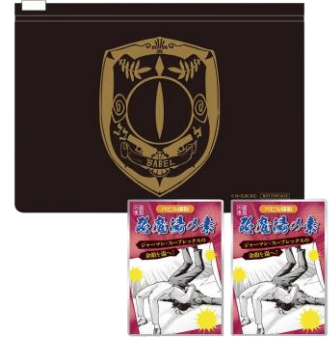
パピル謹製バスパウダー