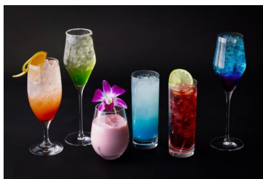
オリジナルノンアルコールドリンク