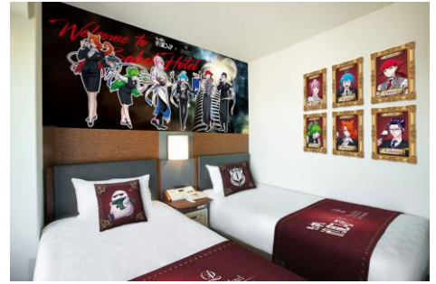
コンセプトルームイメージ

※料金はご宿泊日、ご利用人数により異なります。詳細は専用 Web サイトをご確認ください。