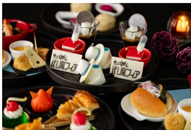
コラボレーションアフタヌーンティー