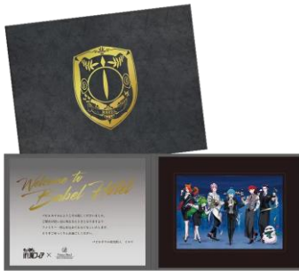
ウェルカムカード風キャラファインフォリオ

コンセプトルームご宿泊のお客さま限定でお持ち帰りいただける、描き下ろしイラストなどを使用したオリジナルグッズをご用意しております。また、コンセプトルーム限定カードキー、カードキーケースもご用意しております。