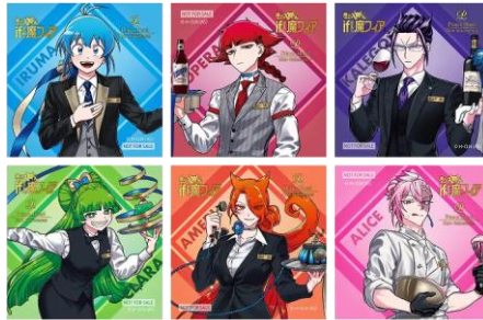
ホログラムスマホシール