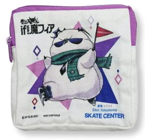
KOSÉ 新横浜スケートセンター オリジナル描き下ろしグッズ

©本件に関する報道各位からのお問合せ 新横浜プリンスホテル マーケティング/広報担当 TEL:045-471-1113 FAX:045-471-1189