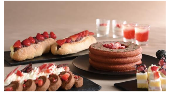
いちごスイーツ (イメージ)