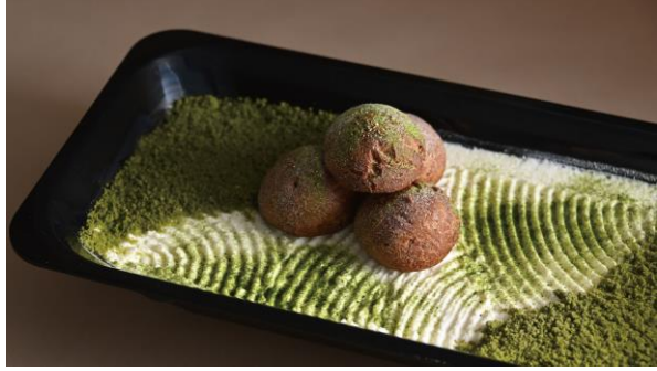
抹茶と豆乳のティラミス 庭園風飾り (イメージ)