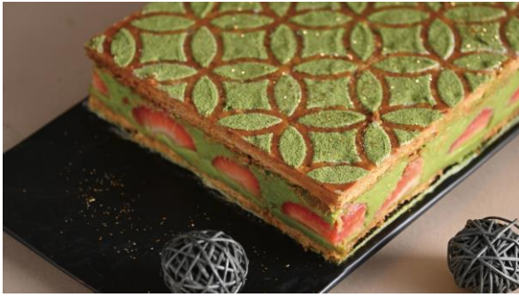
抹茶といちごのミルフィーユ (イメージ)