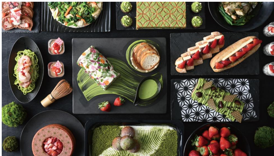
いちごブッフェメニュー (イメージ)

ホテル最上階の会場からは、瀬戸内海の景色もご満喫いただけます。段々と春めく瀬戸内海を借景に、瑞々しいいちごや和のエッセンスを取り入れたスイーツ、ランチメニューをお楽しみください。