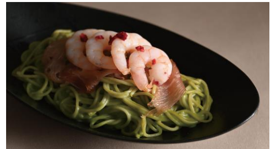
海老と生ハムの抹茶クリームパスタ (イメージ)