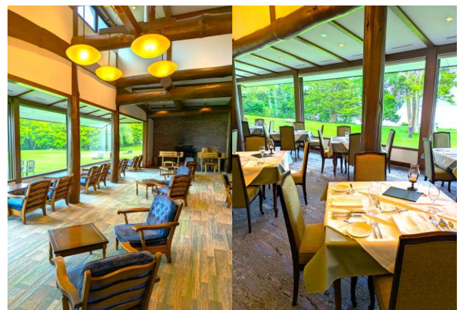
リニューアルされたロビー・レストラン