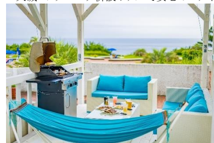
Rivage Blue BBQ