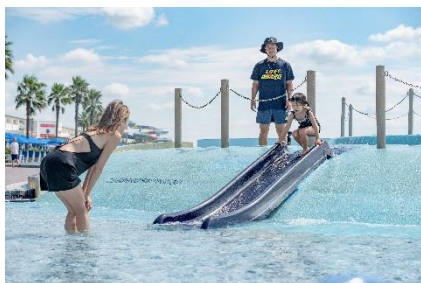
安心のライフガードによる見守り

夕暮れからの敷地内専用エリアでの手持ち花火体験など、大磯プリンスホテルに泊まって大磯ロングビーチを満喫できる贅沢な時間をお過ごしいただけます。