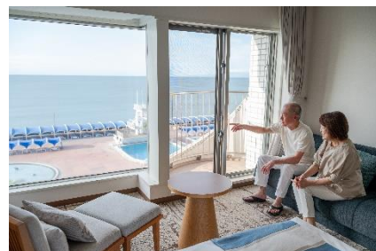
大磯ロングビーチ併設ホテルで安心のステイ