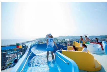
ウォータースライダー