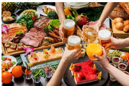
サマーディナーbuffet “子どもが主役のビアホール”