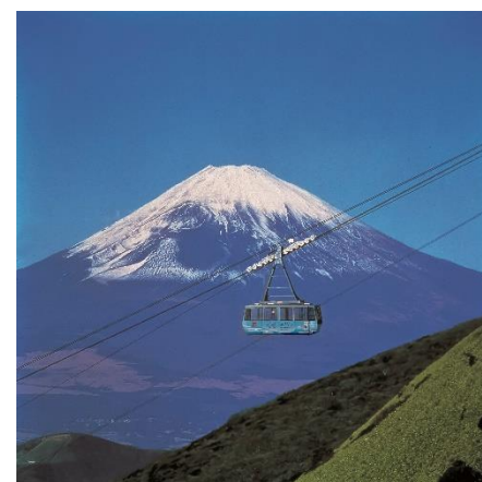
箱根 駒ヶ岳ロープウェイ

【参考 URL】 https://www.princehotels.co.jp/amuse/hakone-en/ropeway/