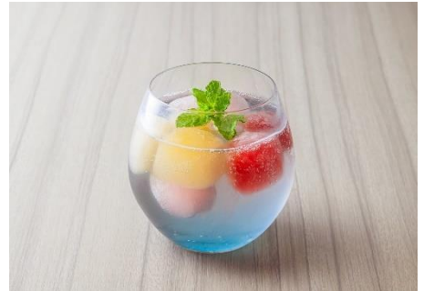
サイダー 「彩り泡水」イメージ

カラフルな「LovePiano®」1号機とさまざまな音色をイメージして考案したドリンクです。水色のサイダーの中には柚子やザクロのシロップで作った氷が浮かび、氷の色ごとに違う味の発見があります。時間が経つとそれぞれの氷が溶けだし、味の変化も楽しめる仕掛けになっています。まるで音楽の和音のように、それぞれの味が溶けあい、広がるドリンクです。