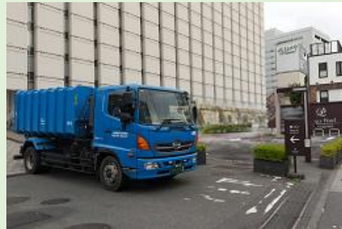
フードロス資源を受け入れ先へ運搬