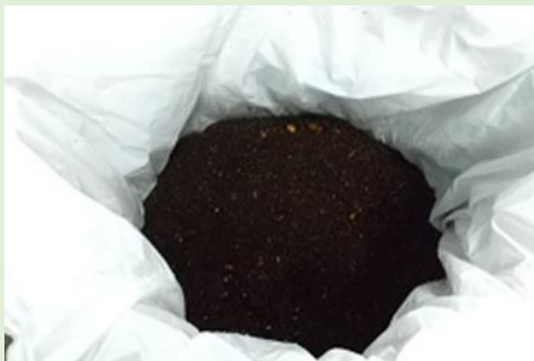
処理後のフードロス資源