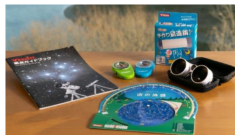
星空観察体験グッズ