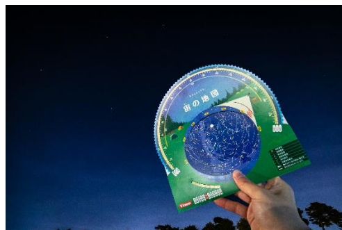
星空観察体験イメージ

【ご予約・お問合せ】 宿泊予約係 TEL:04-2925-7114(受付時間:10:00A.M.～5:00P.M.)