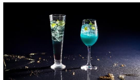
星空をイメージしたカクテル、モクテル