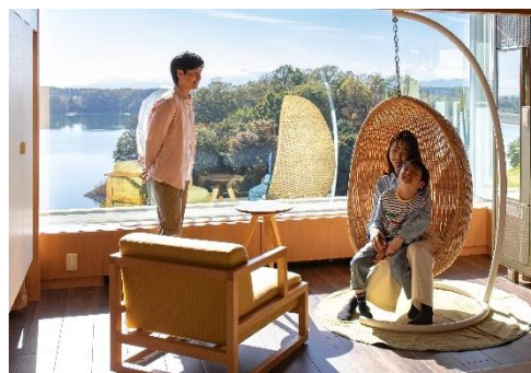
客室滞在イメージ

※8月8日(金)については『「星空観察会」付き星空観察体験ステイ』のみの予約受付となります。