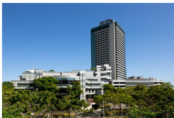
グランドプリンスホテル大阪ベイ