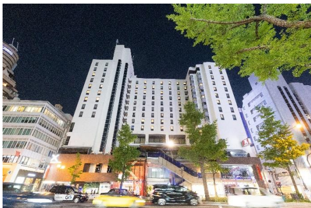
クロスホテル大阪