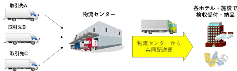
共同配送イメージ

西武・プリンスホテルズは2016年10月より自社の都内8ホテルにて「共同配送」を順次開始し、2022年10月には箱根・湘南エリア、2024年4月には京都・滋賀エリアで開始するなど、徐々に自社内で実施エリアを拡大してまいりました。オリックス・ホテルマネジメントとの協働は、西武・プリンスホテルズが他社ホテルと取り組む初めての「共同配送」として2024年7月より箱根エリアにて開始し、2024年11月より京都・滋賀エリアに拡大、そして今回、大阪市内と実施エリアをさらに拡大いたします。両社の「共同配送」の協働は、物流の「2024年問題」などの社会的課題や大阪・関西万博会期中の交通円滑化に取り組むと同時に、地域連携を強化し、観光業の持続的成長への貢献を目指します。