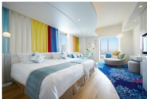
ホテル ユニバーサル ポート