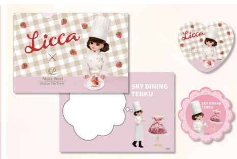
リカちゃん考案スイーツメニュー 「Fraise et ruban」