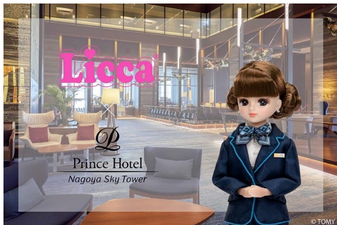
名古屋プリンスホテル スカイトワーとリカちゃんのコラボレーション

レストラン：ご希望のお客さまには、Fraise et ruban に「Happy Licca Day 0503」のチョコプレートを付けてご提供