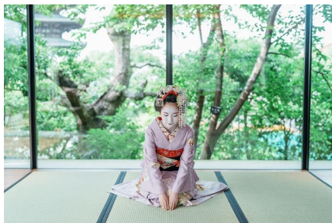
ゲストラウンジで定期的に行われる Maiko Performance