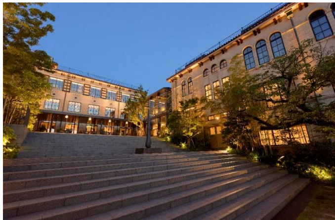
ライトアップされたザ・ホテル青龍 京都清水