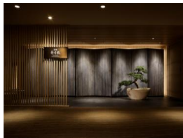
高輪 花香路 (グランドプリンスホテル高輪内)