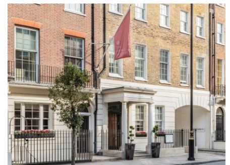
The Prince Akatoki Londonの外観