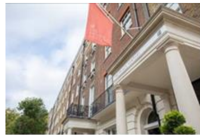
The Prince Akatoki London

©本件に関する報道各位からのお問合せ 株式会社西武・プリンスホテルズワールドワイド 広報部 TEL:03-6709-3302 FAX:03-6709-3400