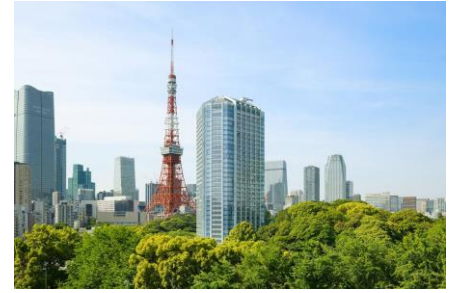
ザ・プリンス パークタワー東京の外観