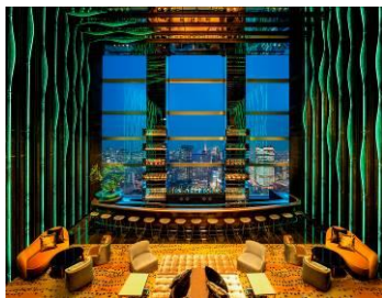
ザ・プリンスギャラリー 東京紀尾井町