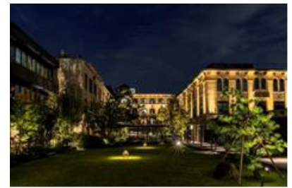
ザ・ホテル青龍 京都清水の夜の外観