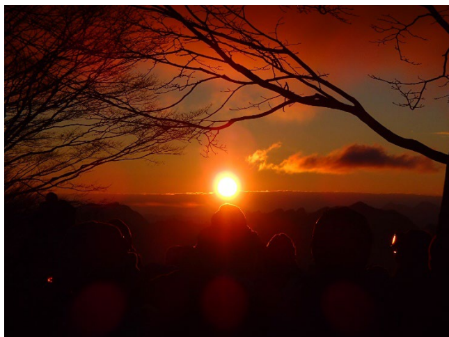
スキー場山頂から見える初日の出のイメージ(2024年元日)

スキーヤー・スノーボーダーにとっては新年の「滑り初め」にご利用いただけるほか、スキーやスノーボードをしない方の「年初めイベント」、愛犬家の方はケージに入れた愛犬と一緒に「散歩初め」に山頂へ上り、リードを着用すれば雪上の散歩をすることができます。新年の始まりを、心温まるひと時でお迎えいただけます。