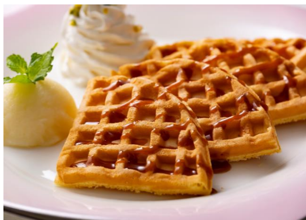
キャラメルワッフル Caramel Waffle