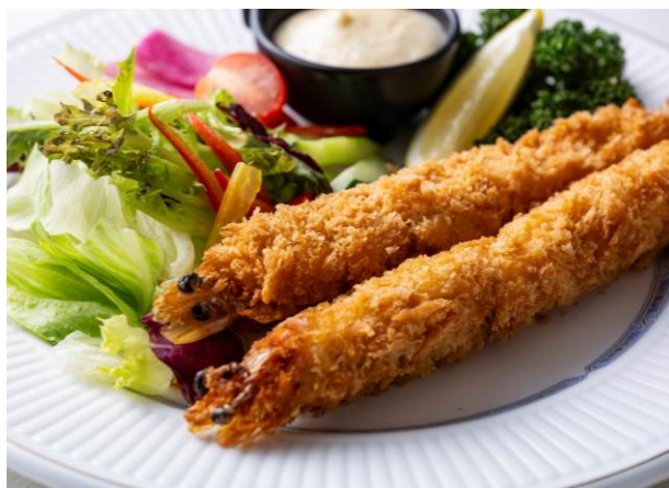
有頭エビのフライ Head-On Fried Prawn