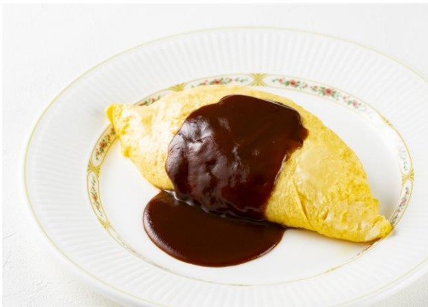
オムライス Omelet & Chicken Rice