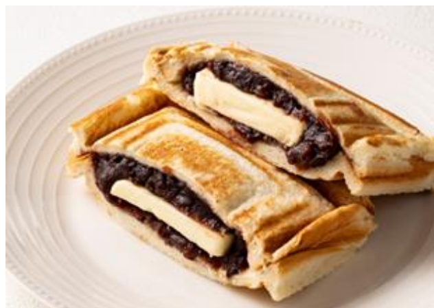
あんバターサンド Red Beans Paste & Butter Sandwich