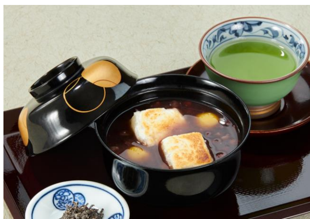
栗ぜんざい Chestnut Zenzai