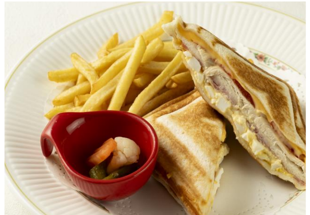
ホットサンドイッチ Hot Sandwich