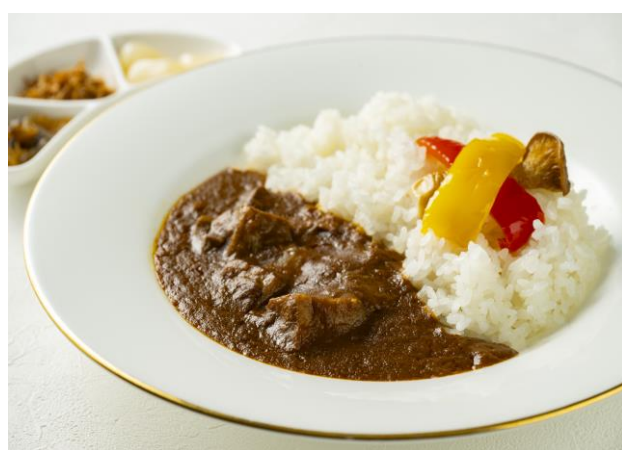
ビーフカレーライス Beef Curry & Rice