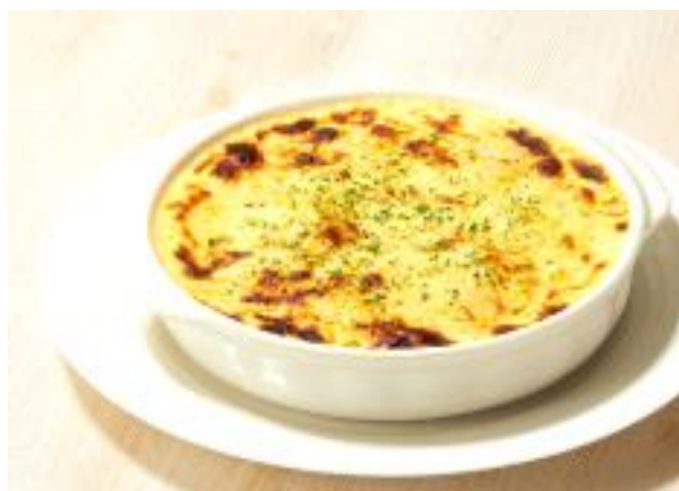
ビーフカレードリア Beef Curry Doria