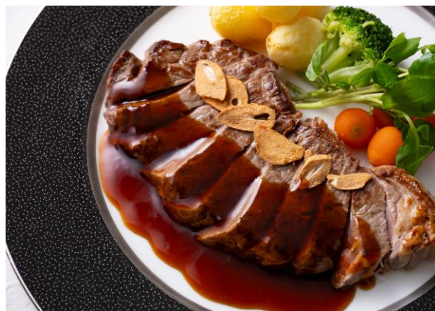
牛サーロインステーキ Beef Sirloin Steak