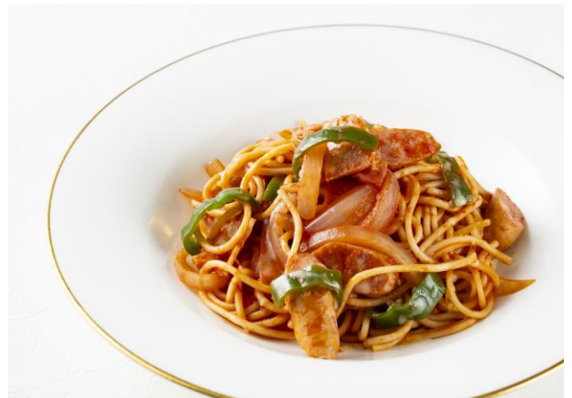
ナポリタンスパゲッティ Spaghetti Napolitan