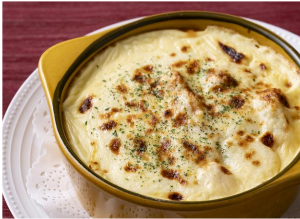
シーフードドリア Seafood Doria