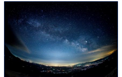
雫石銀河ロープウェイ

雫石の澄みきった空気が、星の光を一層際立たせます。冬のナイトロープウェイで満天の星を体験する星空観察をご提案。「星空の案内人」による、冬の星空解説を聞きながら、雫石の夜空をご鑑賞いただけます。