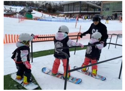
デビューパーク(ハンドレール)

「デビューパーク」を設置します。初めての方でもハンドレールを活用することで安全にスキー・スノーボードを覚えることができ気軽に楽しくゲレンデデビューへと導きます。