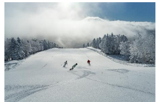
志賀高原 焼額山スキー場