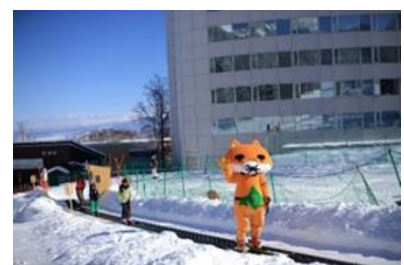
初心者レッスンゾーン

リフトを使わずにコース上部まで昇れる「スノーエスカレーター」を2基設置。ゲレンデデビューをするお子さまや初心者の方も安心してスキー体験をしていただけます。