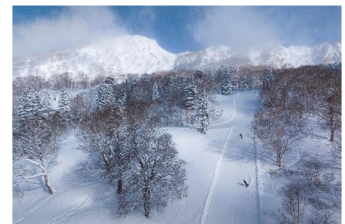
妙高 杉ノ原スキー場

白く輝く山々や野尻湖、そして天候の条件がそろえば雲海や富士山も見ることができ、絶え間なく飛び込んでくる絶景が楽しめます。