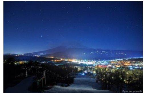
軽井沢プリンスホテルスキー場

星空ウォッチや焚き火体験、専属カメラマンも付いているため、大切な人と過ごす特別な時間を記憶と記録に残す絶景スキー体験です。 ※料金は税抜きです。