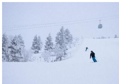
自分だけのシュプールをゲレンデに 描き、その様子は専属カメラマンが撮影