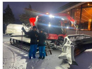
早朝、圧雪車がお出迎え