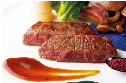
料理長自慢のコース料理を特別室で