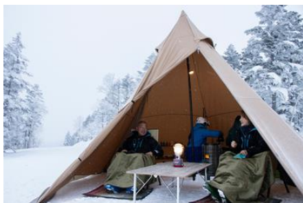
山頂で刻々と変わる風景を楽しみながら スタートの時を待つ